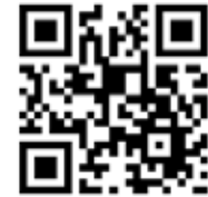
iPads am Convos

Ab Klasse 7 wird die Arbeit mit den iPads an eigenen Geräten vertieft. Das iPad hat dann im Unterricht einen festen Platz und ist nicht nur Schulbuch und Mappe, sondern eröffnet vielfältige neue Lernzugänge.